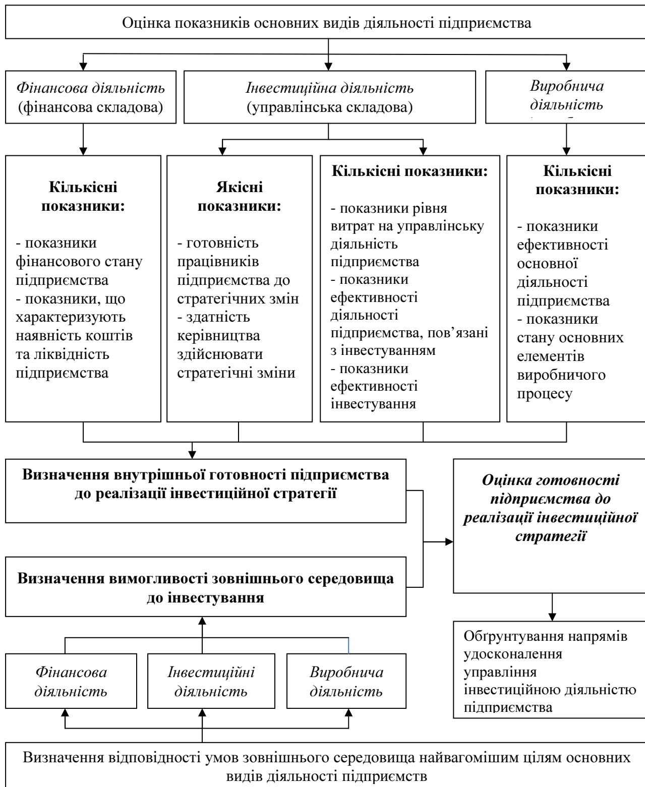
Рис 1. Методичний підхід до оцінки готовності підприємства до реалізації інвестиційної стратегії