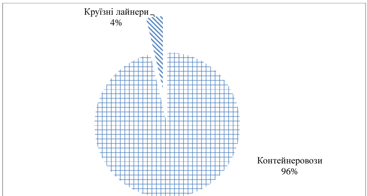
Рис.3 Структура флоту MSC

До складу компанії входять контейнеровози та круїзні лайнери. У інших сегментах судноплавного ринку компанія немає флоту (рис. 3).