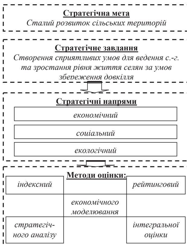
Рис. 1. Стратегічна мета, завдання та напрями розвитку сільських територій

Основним завданнями проведення SWOT-аналізу сільських територій в контексті формування сприятливого соціально-екологічного клімату є такі, як