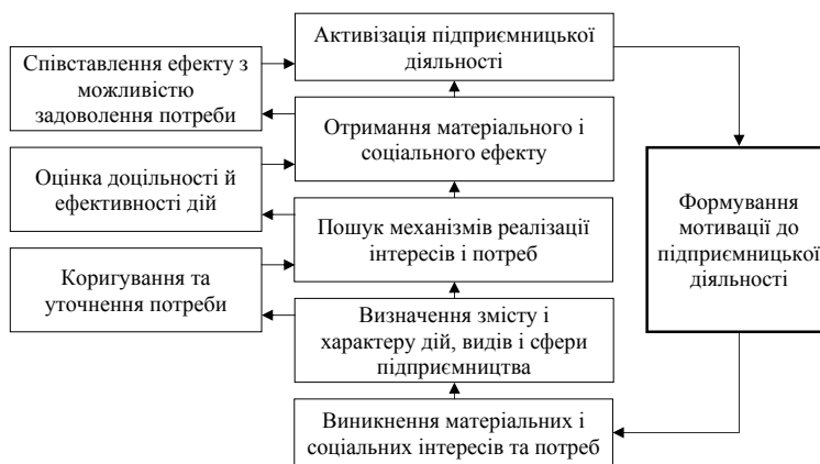
Рис. 1. Алгоритм формування мотивації до підприємництва