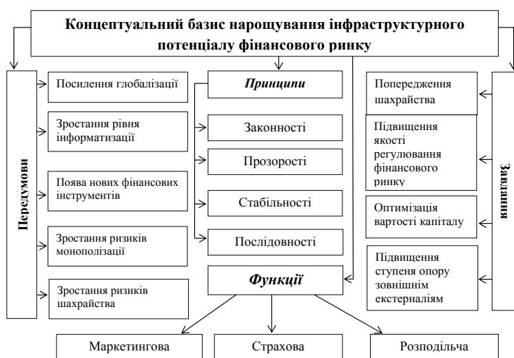
Рис. 1. Структуризація концептуального базису нарощування інфраструктурного потенціалу фінансового ринку