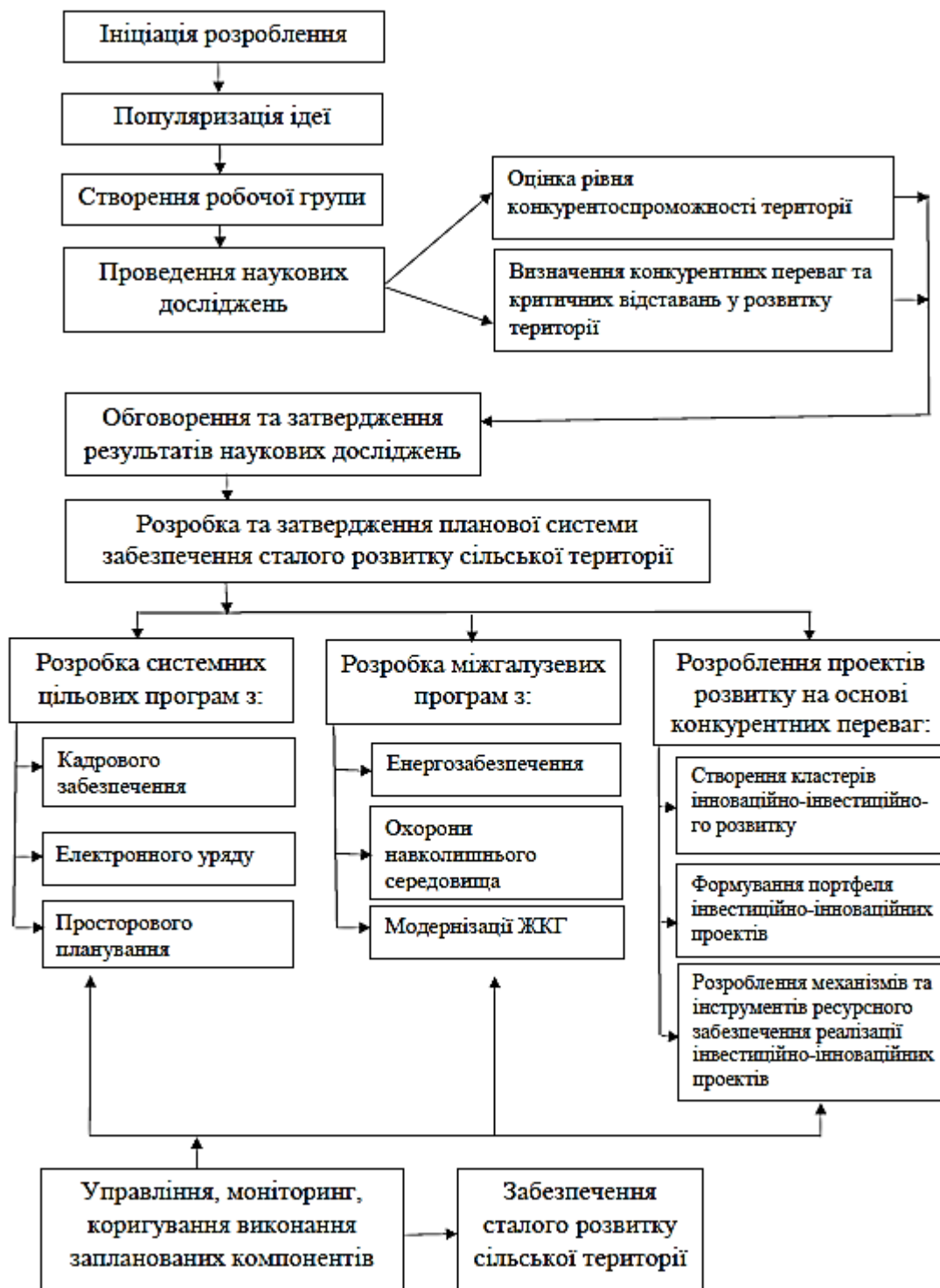
Рис. 1. Алгоритм функціонування планової системи із забезпечення сталого розвитку сільської території