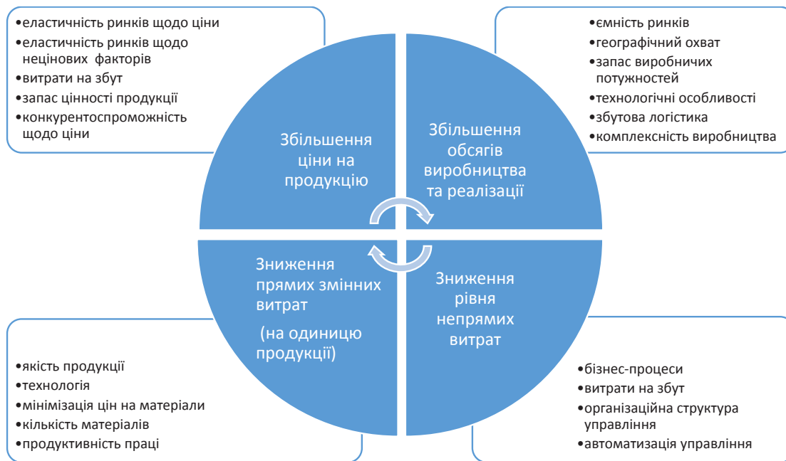
Рис. 1. Стратегії управління зоною беззбитковості підприємства

Як відомо, аналіз беззбитковості ґрунтується на розподілі витрат на постійні та змінні, які в сумі визначають собівартість продукції. До постійних витрат відносять ті, які не змінюються зі збільшенням або зменшенням обсягів виробництва продукції. Змінні ж витрати коливаються пропорційно до таких змін. Зде-