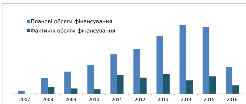
Рис. 2. Співвідношення планових та фактичних обсягів фінансування державних цільових програм протягом 2007–2017 років, млрд. грн.

Для нівелювання цих негативних тенденцій в реалізації державної інвестиційної політики варто виділити такі заходи: