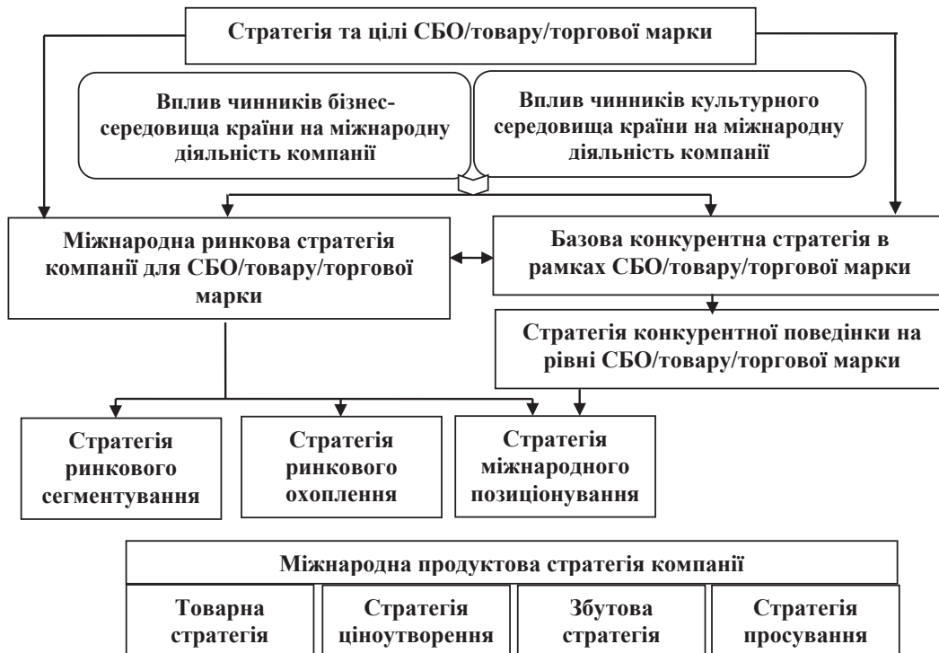
Рис. 1. Місце позиціонування в ланцюгу маркетингових стратегій компанії на рівні СБО/товару/торгової марки