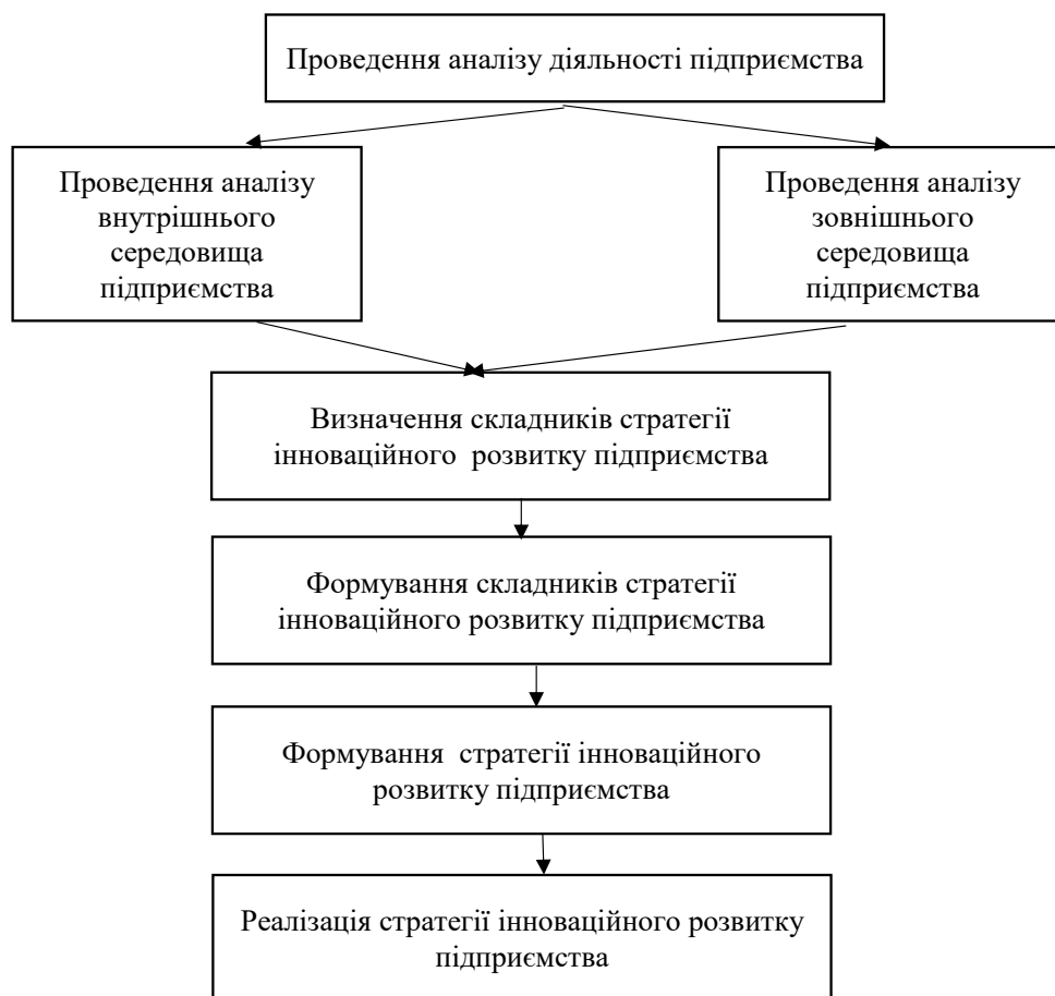
Рис. 2. Порядок формування стратегії інноваційного розвитку сільськогосподарського підприємства

1) у виробничому розвитку необхідно забезпечити: освоєння нових технологій, проведення реконструкції наявного технічного обладнання та впровадження нового, здійснення модернізації окремих технологіч-