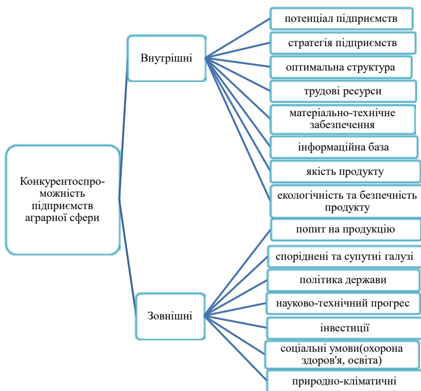
Рис. 2. Чинники конкурентоспроможності аграрного сектору національної економіки

Висновки з проведеного дослідження. Аграрний сектор є одним із бюджетоутворюючих секторів економіки, важливим експортером, постачальником продуктів харчування, фундаментом забезпечення продовольчої безпеки, тому забезпечення оптимального рівня конкурентоспроможності аграрного сектору національної економіки є нагальною проблемою. Детальний аналіз зовнішніх та внутрішніх чинників впливу дасть змогу посилити конкурентні переваги як аграрного сектору, так і національної економіки у цілому. Основним вектором забезпечення оптимального рівня конкурентоспроможності має стати державна підтримка аграрного сектору, спрямована на розвиток інфраструктури аграрного сектору, вдосконалення правової бази, поліпшення інвестиційного клімату та забезпечення належних соціальних умов, якості, екологічності та безпечності продукту. Вирішення цих першочергових проблем забезпечить стійкі конкурентні переваги національної економіки на міжнародній арені.