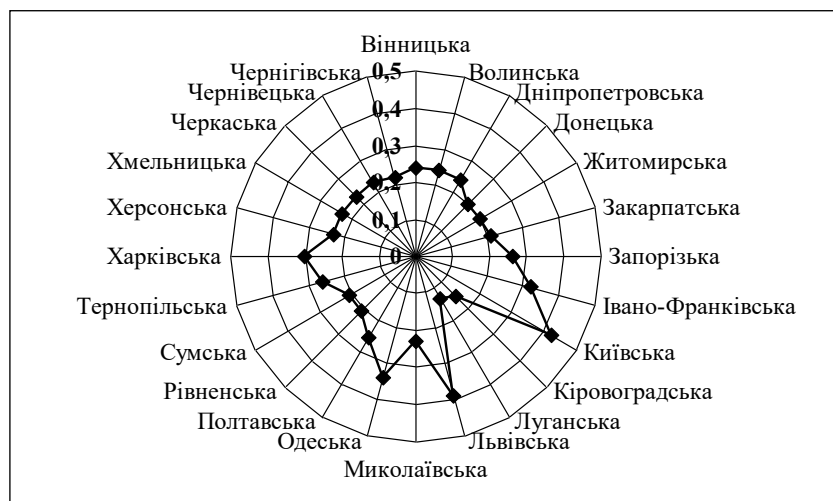
Рис. 2. Інтегральний рівень стратегічного потенціалу туристичної сфери за регіонами України

Досягнення поставленої мети забезпечить поліпшення соціально-економічних показників, зокрема збільшення податкових надходжень до бюджетів усіх рівнів; підвищення рівня життя населення за рахунок зростання відсотку зайнятості та середньої зарплати в туристичній індустрії; зростання якості життя за рахунок підвищення культурного рівня та патріотичного виховання населення [12].