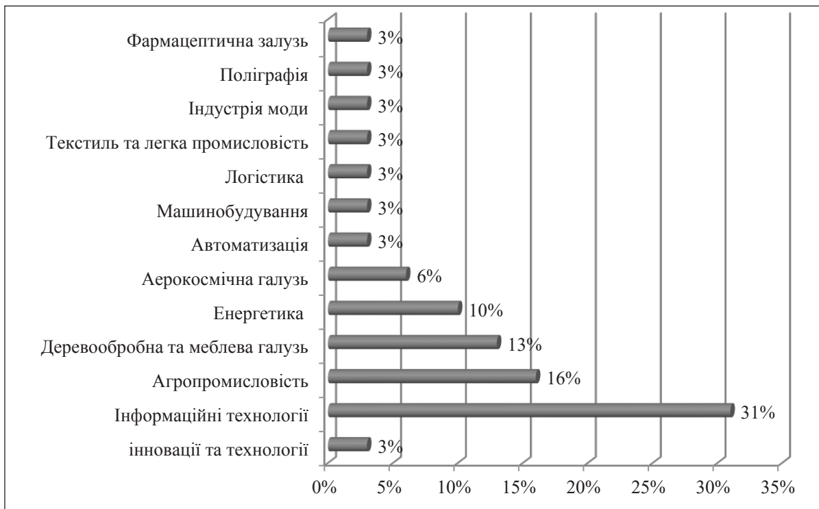
Рис. 2. Розподіл кластерів України за видами економічної діяльності