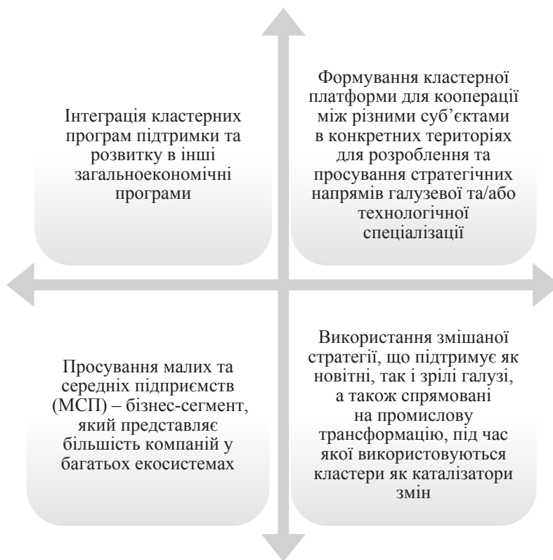
Рис. 3. Напрями розвитку організаційних інструментів (державних програм) підтримки кластерів в Україні