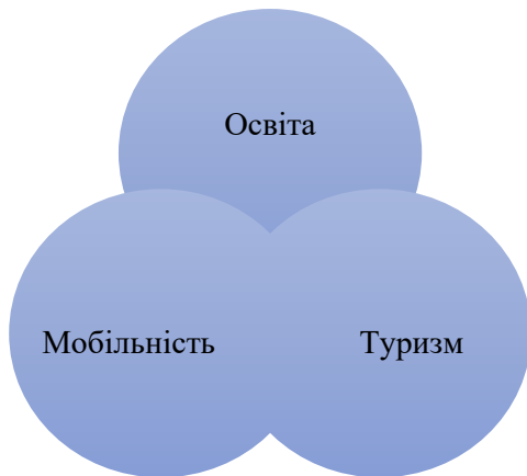
Рис. 2. Графічна модель «МЕТ» (Mobility, Education, Tourism)

виділяють формальну, неформальну та інші види освіти, які мають неформалізований та часто спорадичний характер [9].