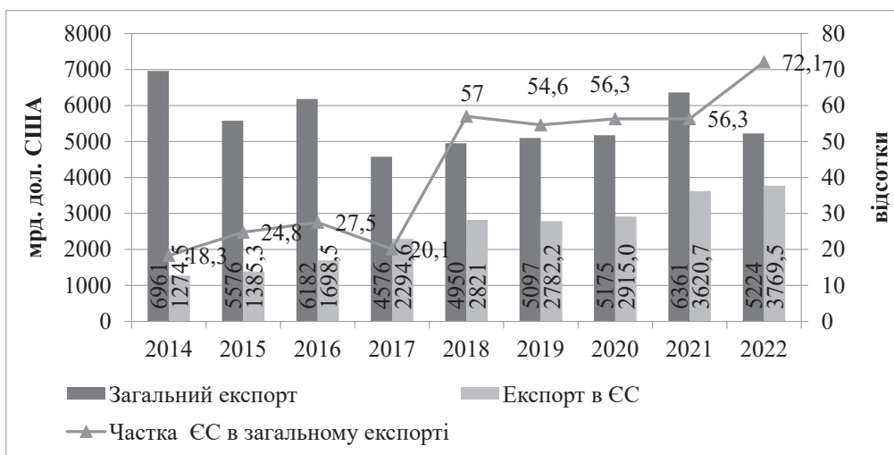
Рис. 2. Динаміка експорту споживчих товарів з України

Зацікавленість ЄС в імпорті чорних металів створює значні загрози для навколишнього середовища в довгостроковій перспективі, оскільки металургійні галузі з недостатньою технологічністю та екологічністю є ключовими забруднювачами. Щодо експорту рослинної продукції, то тут переважають зернові (соняшник, кукурудза, пшениця), олія та жири, що також створює певні загрози, пов'язані з виснаженням та пошкодженням ґрунту. Також значною загрозою безпеці споживання є наповнення українського ринку європейськими продуктами різної якості з різним ступенем обробки. Простежимо динаміку імпорту споживчих товарів в Україну (рис. 3).