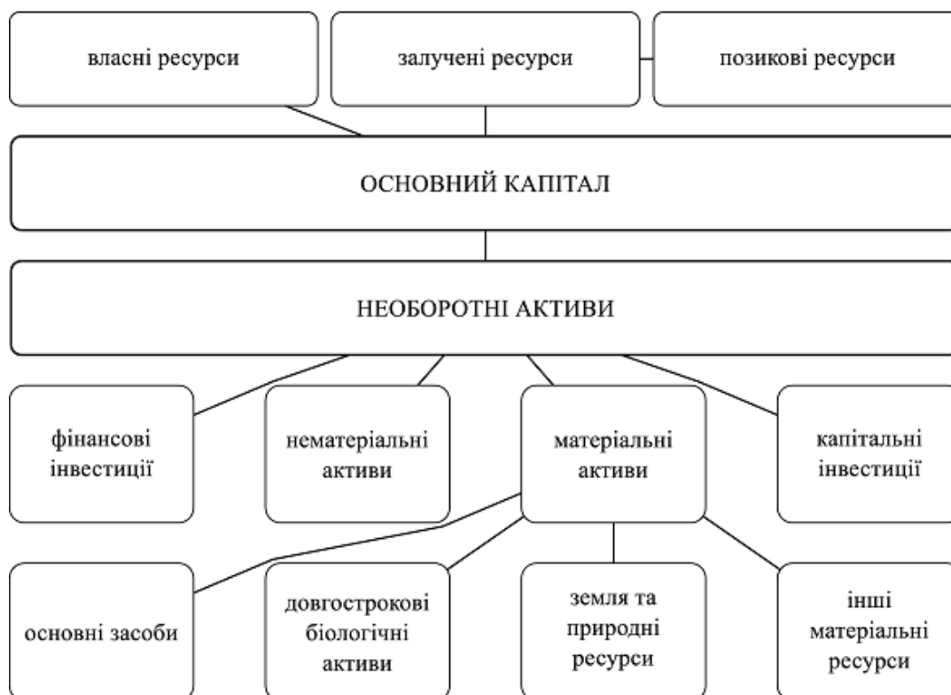
Рис. 2. Структура основного капіталу підприємства за джерелами виникнення та об'єктом інвестування